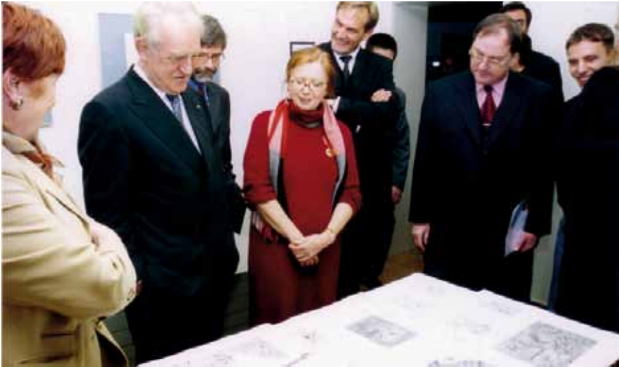
Bundespräsident a.D. Johannes Rau (2. v. l.) besucht 2003 den Durchblick e.V.