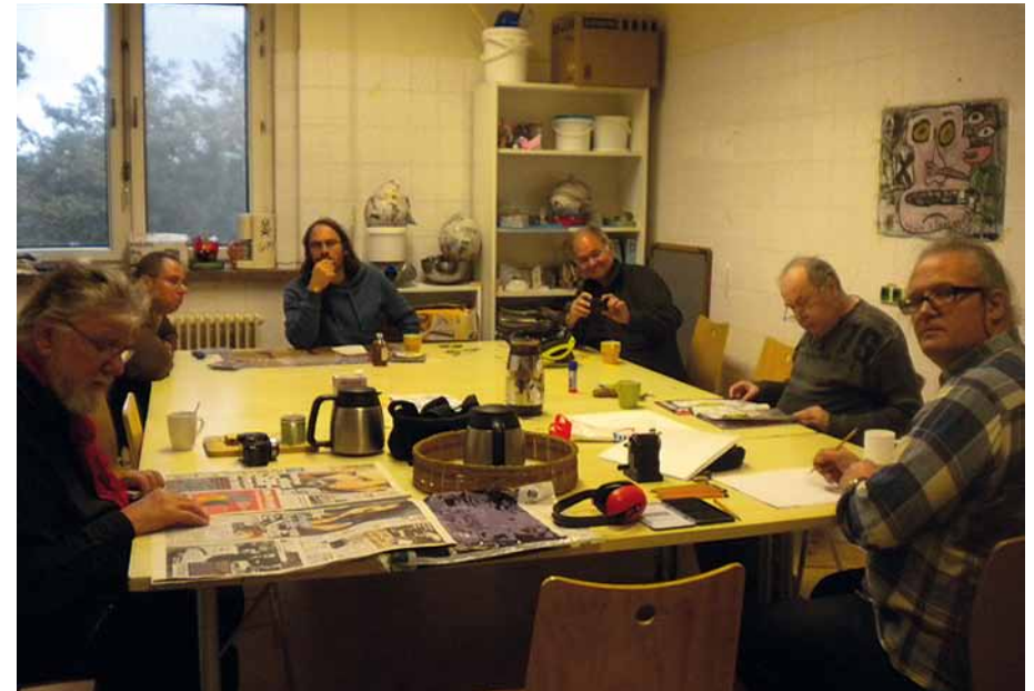
Einjähriges Interim in ehemaligen Krankenhaus Friesenstraße