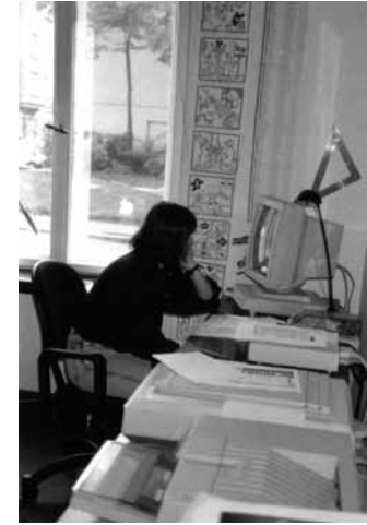
Gottschedstraße 15 (Tür bemalt von Peter Melcher), Hinterhof, 1991, erste eigene Vereinsräume und Integrationsfirma DurchblickDesign