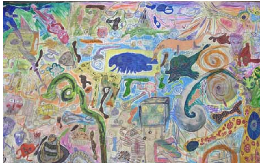
Gemeinschaftsarbeit (JOD, Bolte & friends)

Der Durchblick e.V. wurde im Juni 1990 gegründet. In einem Uni-Hörsaal fanden regelmäßig größere Veranstaltungen zur Aufarbeitung des DDR-Psychiatrie-Unrechts statt, die jeweils großen Anklang fanden. Durch mein manisches Verhalten verdiente ich mir flächendeckend Hausverbote in fast allen Kneipen und Cafés der Messestadt. Gleichzeitig malte ich wie ein Besessener im manischen Schaffensrausch zum ersten Mal richtig große Ölbilder und entwickelte einen eigenen künstlerischen Stil, hatte meine erste große Ausstellung bei der Eröffnung des Boot e.V. Ich setzte mich für eine Kunst ohne Etikette ein, man versuchte nämlich, die Maske von