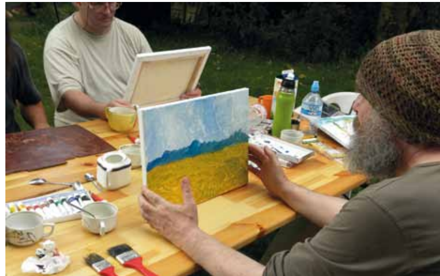
Kunstgruppenfahrt nach Dommitzsch, 2009