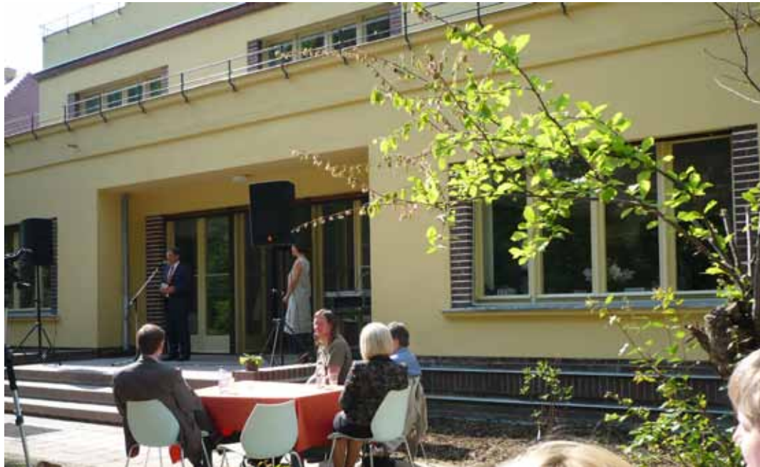
Wiederöffnung des sanierten Hauses Mainzer Straße 7 am 29. April 2011

Durchblick e.V. Mainzer Straße 7 04109 Leipzig Tel. 0341 1406140 Fax 0341 14061419