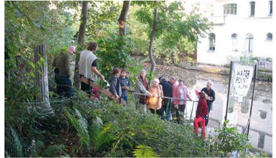
Einweihung des Bootsstegs