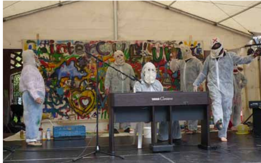
Kunstaktion »Graffiti« zur InterCultura 2009

Zum Schluss möchte ich von einigen Durchblickbesuchern gerne erfahren, wie sie außerhalb der Psychiatrie ihre Nischen finden. Der Begriff ›Außerhalb‹ scheint zunächst eine Definitionsfrage zu sein.