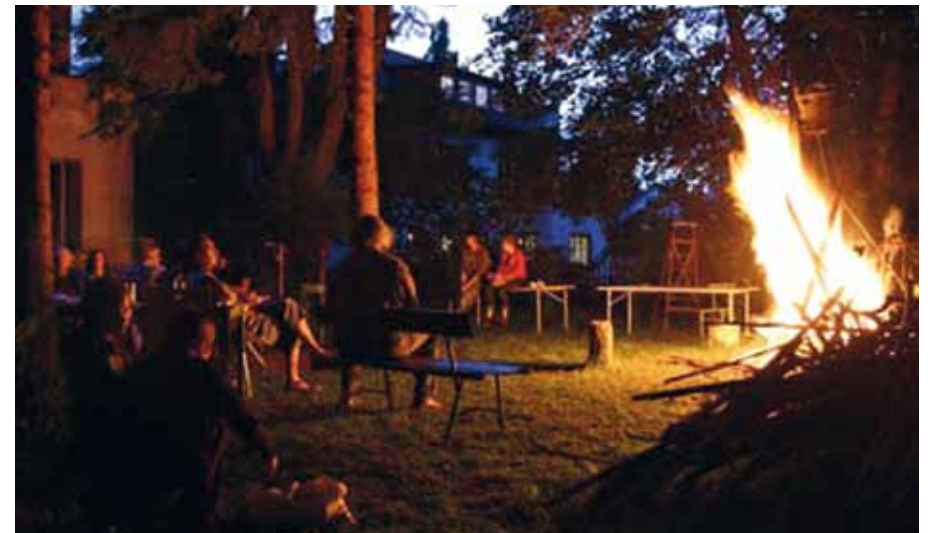
Feste enden oft mit einem Lagerfeuer im Garten